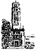
Recinto de Río Piedras

DECANOS Y DIRECTORES DE ESCUELAS Y DEPARTAMENTOS ACADÉMICOS DEL RECINTO DE RÍO PIEDRAS