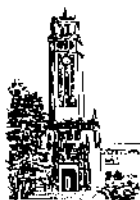
Recinto de Río Piedras

DECANOS, DIRECTORES, OFICIALES EJECUTIVOS, PERSONAL ADMINISTRATIVO DE UNIDADES ACADÉMICAS Y ADMINISTRATIVAS DEL RECINTO DE RÍO PIEDRAS