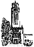
Oficina del Decano de Administración