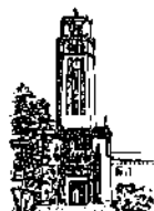
Oficina del Decano de Administración