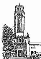
Recinto de Río Piedras