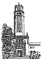
Recinto de Río Piedras

Con el propósito de mantener información clara y confiable de los datos en el sistema de facturación de los servicios telefónicos, es necesario que al someter las solicitudes nos suministren la siguiente información: