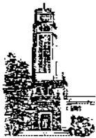
Recinto de Río Piedras

DECANOS, DIRECTORES Y PERSONAL DE APOYO EN LAS UNIDADES ACADÉMICAS Y ADMINISTRATIVAS