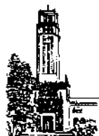
Oficina del Decano de Administración

Como parte de las actividades de educación en salud, establecidas en el contrato del Plan Médico de La Cruz Azul de Puerto Rico, la Oficina de Recursos Humanos, y dicha compañía llevarán a cabo las siguientes actividades: