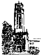
Oficina del Decano de Administración