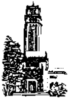
Oficina del Decano de Administración