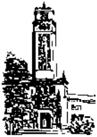
Recinto de Río Piedras

DECANOS, DIRECTORES DE FACULTADES AUTÓNOMAS Y OFICINAS ADMINISTRATIVAS, DIRECTOR DE LA DIVISIÓN DE EDUCACIÓN CONTINUADA Y ESTUDIOS PROFESIONALES