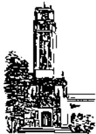
Recinto de Río Piedras