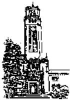
Recinto de Río Piedras