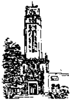
Recinto de Río Piedras

A TODO EL PERSONAL DEL RECINTO DE RÍO PIEDRAS