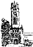
Recinto de Rio Piedras