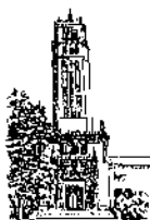
Recinto de Río Piedras