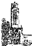
Recinto de Río Piedras