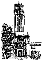
Recinto de Río Piedras