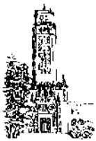
Recinto de Río Piedras

DECANOS(AS), DIRECTORES(AS) DE OFICINA Y PERSONAL RESPONSABLE DE LA PREPARACION DE REQUISICIONES DE SUMINISTROS EN LAS UNIDADES ACADEMICAS Y ADMINISTRATIVAS