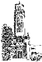
Recinto de Río Piedras