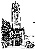
Recinto de Río Piedras

DECANOS, DIRECTORES, OFICIALES EJECUTIVOS, PERSONAL ADMINISTRATIVO DE UNIDADES ACADÉMICAS Y ADMINISTRATIVAS DEL RECINTO DE RÍO PIEDRAS