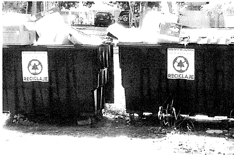
Estos contenedores fueron removidos del área. Se reubicarán para lograr el uso adecuado.